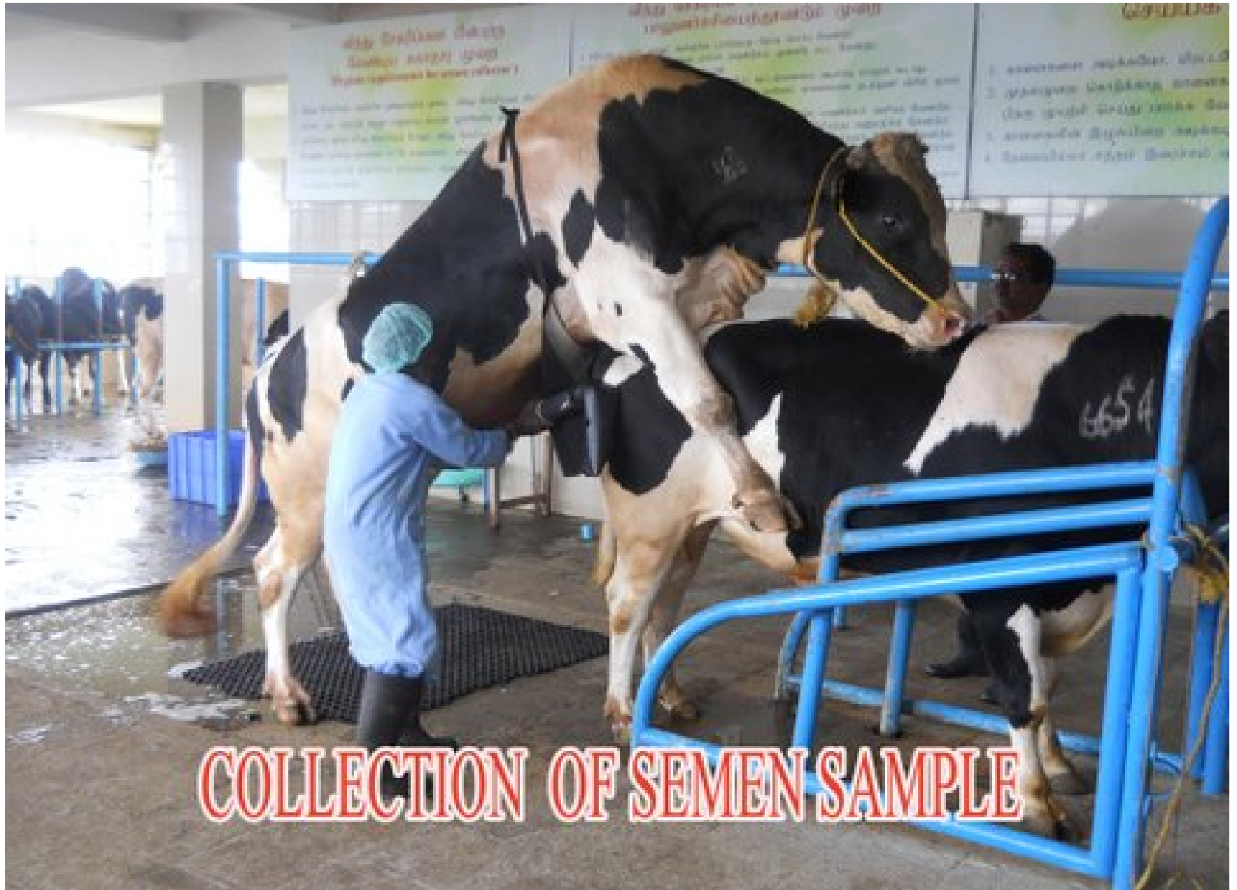
COLLECTION OF SEMEN SAMPLE